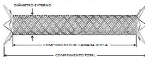
Figura 3. Stent CASPER (Implantado/restrito)