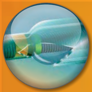
Balão com Revestimento Hidrofílico