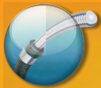
Compatível com guia 014